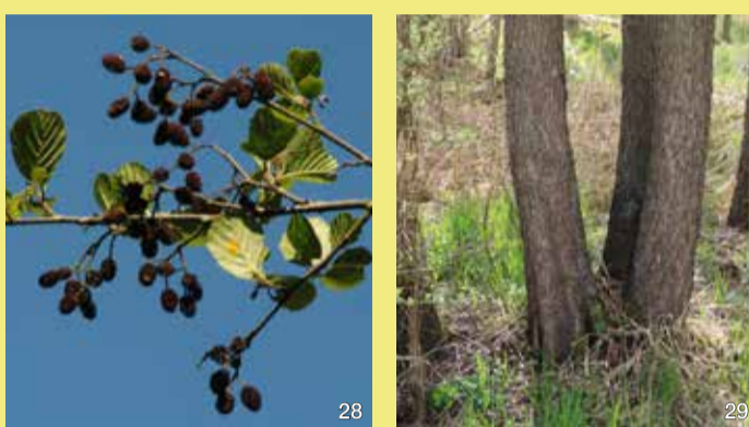
Früchte der Erle

Das Salzwasser tritt nicht großflächig aus, sondern in begrenzten Quellgebieten. Dort ist kein Baumwuchs möglich. Hier befinden wir uns aber am Rand des Travetunneltales, das während der letzten Eiszeit unter dem Eis von den Schmelzwässern geschaffen wurde. Der Erlenbruchwald wird vom Süßwasser gespeist, das am Fuß des Talhanges austritt. Gäbe es keine Nutzung im Travetal, wären weite Bereiche mit Erlenwald bestanden. Er ist das Endstadium der natürlichen Sukzession auf den nassen Böden.