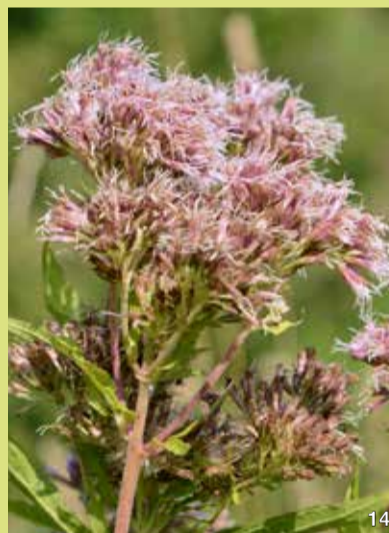
Wasserdost ( Eupatorium cannabinum )

Der Wasserdost wächst gern in der Nachbarschaft des Zottigen Weidenröschens. Seine Blätter sind handförmig gefiedert mit drei bis sieben Fiederblättchen und ähneln entfernt dem Hanf, daher nennt man diese Pflanze auch Wasserhanf. Die großen Blütenstände setzen sich aus vielen kleinen rosafarbenen Einzelblüten zusammen. Im Herbst entstehen aus ihnen Früchte mit weißen Haaren, die der Wind verbreitet. Die Blüten werden von Insekten bestäubt, vor allem von Schmetterlingen und Schwebfliegen.