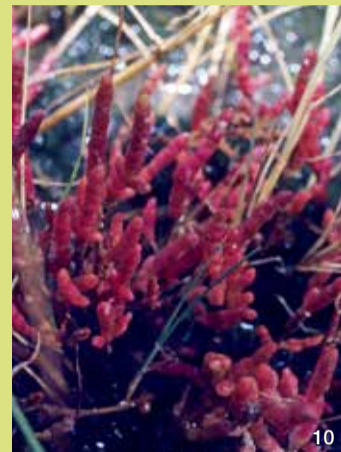
Queller, rechts in roter Herbstfärbung

Der Strand-Dreizack fällt durch seine dichten Büschel von grasartigen Trieben auf, aus denen der Blütenstand bis zu 50 cm hoch herausragt. Die Blüten stehen dicht nebeneinander und sind unscheinbar grünlich. Die Bestäubung der Blüten erfolgt durch den Wind. Die Blätter speichern Luft und werden, wenn sie zu viel Salz enthalten, von der Pflanze abgeworfen. Die Pflanze bildet unterirdische Rhizome aus und vermehrt sich auf diese Weise vegetativ.