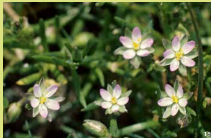
Salz-Schuppenmiere ( Spergularia salina )

Das Salz-Schuppenmiere ist einjährig wie der Queller. Sie gehört zu den Nelkengewächsen. Ihre niederliegenden Stängel ermöglichen es ihr, im Brenner Moor auch in den Ritzen zwischen den Holzbohlen einen Platz zum Wachsen zu finden. Ihre Blätter sind dickfleischig. Sie blüht über einen langen Zeitraum bis in den Spätsommer hinein. Die weiß- bis rosafarbenen Kronblätter sind von Kelchblättern umgeben, die durch einen weißen Hautrand auffallen.