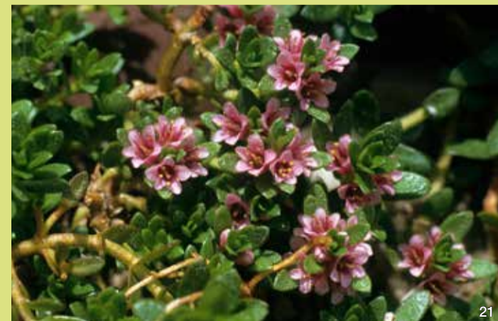
Milchkraut ( Glaux maritima )

Der Salzaster ist mit unseren Gartenastern verwandt und blüht ähnlich wie diese im August. Die Salzaster besitzt zwei Arten von Blüten in ihren Blütenköpfchen: die hellvioletten Zungenblüten außen und die gelben Röhrenblüten innen. Nach der Blütezeit bilden die Köpfchen behaarte Früchte, die wie Wolle auf den Pflanzen liegen und vom Wind verbreitet werden.