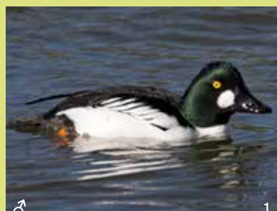
Schellente ( Bucephala clangula )