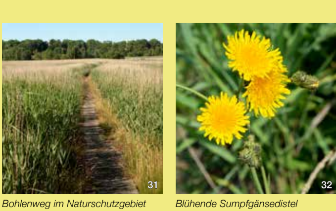
Bohlenweg im Naturschutzgebiet

Hier sieht es aus, wie man sich ein richtiges Flachmoor vorstellt: viel Schilf auf schwankenden Torfböden. Tatsächlich ist das Gebiet ein Moor aus zweiter Hand, denn noch in den 1930er Jahren waren hier ausgedehnte Weideflächen, die mit einem dichten Netz von Gräben entwässert wurden. Die Oldesloer Kutscher weideten hier ihre Pferde. Erst mit dem Aufkommen des Autos fielen die Weiden brach. So ist das Auto „schuld“ daran, dass sich wieder ein Moor entwickeln konnte.