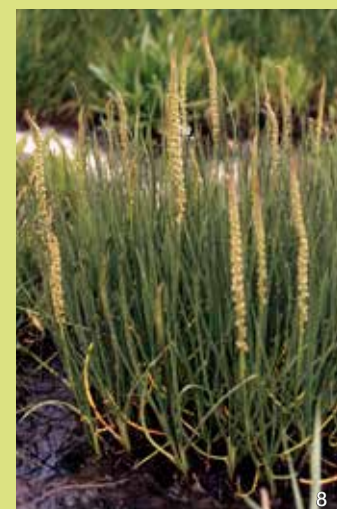
Strand-Dreizack ( Triglochin maritima )

Das Salz-Schuppenmiere ist einjährig wie der Queller. Sie gehört zu den Nelkengewächsen. Ihre niederliegenden Stängel ermöglichen es ihr, im Brenner Moor auch in den Ritzen zwischen den Holzbohlen einen Platz zum Wachsen zu finden. Ihre Blätter sind dickfleischig. Sie blüht über einen langen Zeitraum bis in den Spätsommer hinein. Die weiß- bis rosafarbenen Kronblätter sind von Kelchblättern umgeben, die durch einen weißen Hautrand auffallen.