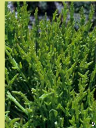
Queller, rechts in roter Herbstfärbung

Der Queller ist eine einjährige Salzpflanze, die unter den Salzpflanzen im Brenner Moor den höchsten Salzgehalt erträgt. Ihre Stängel sind dickfleischig und verzweigt. Die dort eingesenkten Blüten sind schwer zu erkennen. Der Queller kann in seinem Gewebe viel Salz speichern, er nimmt gleichzeitig größere Mengen Wasser zur Verdünnung der Salzkonzentration auf. Aber wenn die diese zu hoch wird, verfärbt sich die Pflanze und stirbt ab.