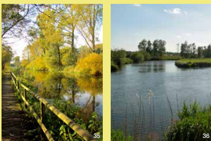
Bohlenweg an begradigter Trave

Da die neue Trave nicht einmal 100 Jahre alt ist, wird manchmal die Frage gestellt, ob sich der alte Lauf nicht wiederherstellen ließe. Man könnte die Altarme wieder miteinander verbinden, das neue Bett zuschütten und der alte Lauf wäre wieder da. Allerdings muss bedacht werden, dass sich seit dem Ausbau die Vegetation zum Erlenbruch entwickelt hat, so dass heute durch eine Remäandrierung zu viel zerstört würde.