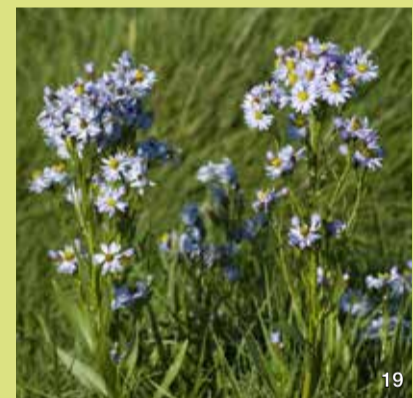
Salzaster ( Aster tripolium )

Das Milchkraut hat fleischige Stängel mit dicklichen Blättern und winzigen, hellrosanen Blüten in den Blattachsen. Es blüht im Mai und Juni. Wenn die Pflanze im vollen Sonnenlicht steht, sind die Stängel kurz und mit Blüten übersät. Wächst sie allerdings zwischen den Schilfhalmern im Schatten, dann bildet sie lange Stängel und blüht nur selten. Der Name verweist wahrscheinlich auf die Nutzung als Heilpflanze.