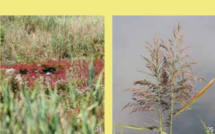
Salzstelle mit Queller

Da das Schilf keine Salzpflanze ist, wird es hier vom Salz geschädigt und bleibt klein und steril (d.h. es bildet keinen Blütenstand). Aber einzelne Schilfhalm schaffen es, in den Bereich der Salzpflanzen vorzudringen. Man sieht, wie sie sich in einer Reihe in Richtung Salzquelle voranschieben. Das schaffen sie mit Hilfe ihrer Rhizome, d.h. ihrer unterirdischen Wurzelsprosse, durch die sie mit den Schilfpflanzen im Süßwasser verbunden sind.