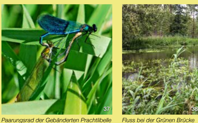
Paarungsrad der Gebänderten Prachtlibelle

Dieser Abschnitt der Trave ist ein guter Platz zur Beobachtung von Libellen. Auffällig sind die dunkelblau schillernden Männchen der Gebänderten Prachtlibelle, die auf den Blättern des Pfeilkrautes sitzen und ihre Reviere bewachen. Die grünlich gefärbten Weibchen sind dagegen wenig auffällig. Die Prachtlibellen werden von großen Mosaikjungfern gejagt, die über dem Wasser Kreise ziehen. Häufig sind auch verschiedene Arten der Heidelibellen und der Azurjungfern zu sehen, die die Ufervegetation bevorzugen.