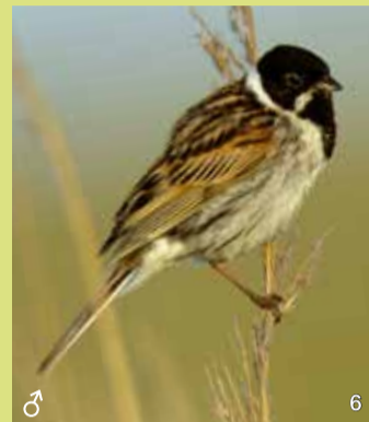
Rohrhammer ( Emberiza schoeniclus )

Die meisten Rohrhammern ziehen im Herbst nach Süden und kommen im März wieder zurück ins Brenner Moor. Sie brüten im Schilf oder im Weidengebüsch. Die Männchen sitzen oft auf hohen Schilfhalmern oder auf Weidenzweigen und markieren durch ihren Gesang ihre Reviere. Sie sind auffällig gefärbt: schwarzer Kopf und schwarze Kehle, weißes Nackenband und weißer Bartstreif. Die Weibchen sind unscheinbar braun im Gefieder, haben aber auch eine weiße Zeichnung im Gesicht.