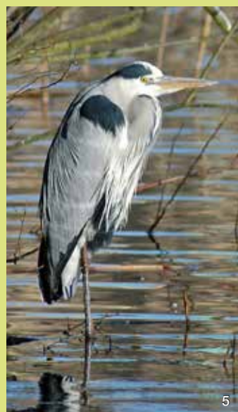
Graureiher ( Ardea cinerea )

Die Männchen der Gebänderten Prachtlibelle haben auffallende blaugefärbte Flügel, die nur an der Spitze und an der Basis durchscheinend sind. Ihr Körper ist metallisch blaugrün gefärbt. Die Weibchen sind etwas unscheinbarer, ihre Flügel sind durchscheinend grünlich gefärbt. Sie lassen sich auf den Wasserpflanzen und im Uferbereich der Trave gut beobachten. Die Weibchen sitzen zum Beispiel auf den Schilfblättern, die Männchen patrouillieren in ihren Revieren am Traveufer.