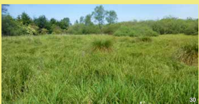
Moorfläche westlich der Deponie

Für Müll wurden früher Flächen gesucht, die billig waren, und die möglichst nahe, aber nicht zu nahe an der Stadt lagen. In der morastigen Fläche ließ sich der Müll gut versenken. Moore waren in den Augen früherer Generationen Unland, es machte große Mühe sie zu entwässern und die Bodenqualität war gering. Das ursprüngliche Brenner Moor war kein Salzmoor, es war vermutlich ein Kalkquellmoor. Reste der einstigen, heute seltenen Vegetation finden sich auf den Moorflächen westlich der Deponie.