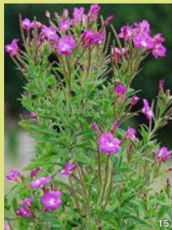
Zottiges Weidenröschen ( Epilobium hirsutum ), Blüten und Früchte

Das Zottige Weidenröschen ist eine häufige Pflanze im Brenner Moor. Es bildet rosafarbene Blüten, aus denen ein langer weißer Griffel mit einer vierteiligen Narbe herausragt. Nach der Befruchtung bildet sich eine längliche grüne Kapsel mit vier Klappen. Wenn diese im Herbst aufplatzt, werden viele weiß behaarte Samen frei. Diese Samen ähneln den Samen der Weidenbüsche, daher kommt der Name „Weidenröschen“. Die Samen werden vom Wind verbreitet.