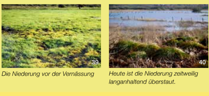
Die Niederung vor der Vernässung

Seit nicht mehr gepumpt wird, bilden sich langandauernde Wasserflächen. Vom Wanderweg aus lassen sich verschiedene Enten- und Limikolenarten beobachten. Die Vegetation ist einerseits vielfältiger geworden, wie man an der Zunahme von Nässezeigern sieht, aber auch einseitiger, wenn man den Rückgang früher dominanter Wiesenarten wie der Sumpfdotterblume oder der Bekassine als Brutvogel betrachtet. Deutlich zugenommen haben die Quellbiotope. An den großen Horsten der Rispensegge kann man erkennen, dass die Niederung wieder ein Ort der „wachsenden Quellen“ geworden ist.