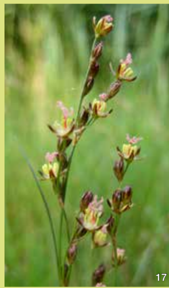
Boddenbinse ( Juncus gerardii )

Die Boddenbinse wächst rasig mit Hilfe von Ausläufern. Sie bedeckt an den Salzquellen größere Flächen und kann auch im Brackwasser zwischen den Schilfhalmern wachsen, kommt dann aber selten zur Blüte. Die Blätter sind zusammengedrückt und rinnig. Die Blüten stehen in einer Spirre. Es lohnt sich, sie genauer anzuschauen, denn sie haben gewellte rosafarbene Griffel. Die Boddenbinse blüht im Sommer. Die Kapseln der Früchte sind dunkelbraun und elliptisch.